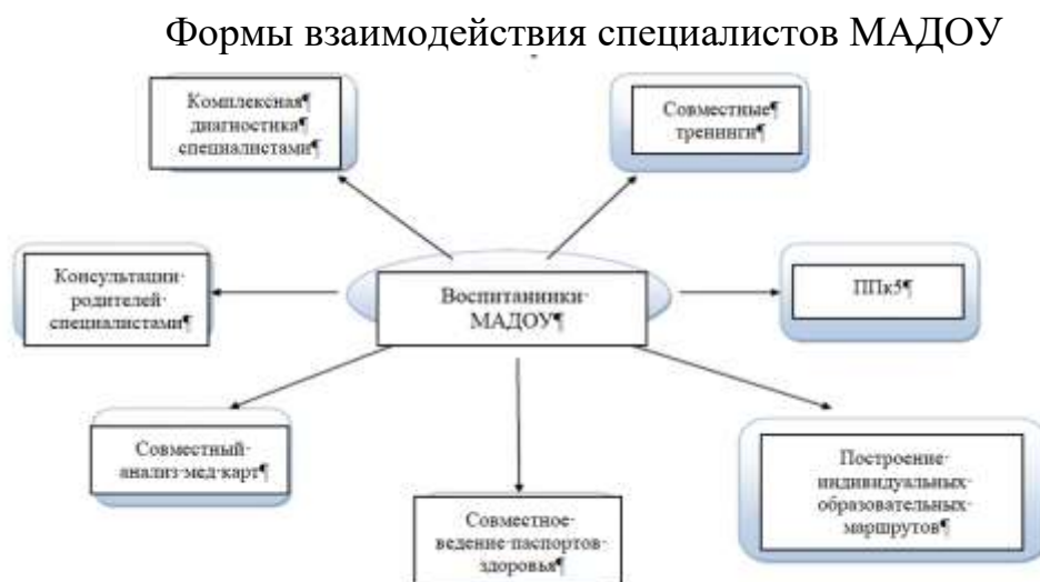
Схема № 1

Согласованная совместная практическая деятельность всех специалистов по внедрению части формируемой участниками образовательных отношений в образовательный процесс, предполагает грамотную интеллектуальную нагрузку, организацию двигательной активности детей в течение дня. Ниже приведены формы взаимодействия, позволяющие координировать деятельность всех специалистов МАДОУ.