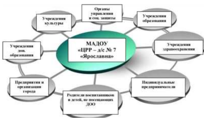
Модель социального партнерства ДОО