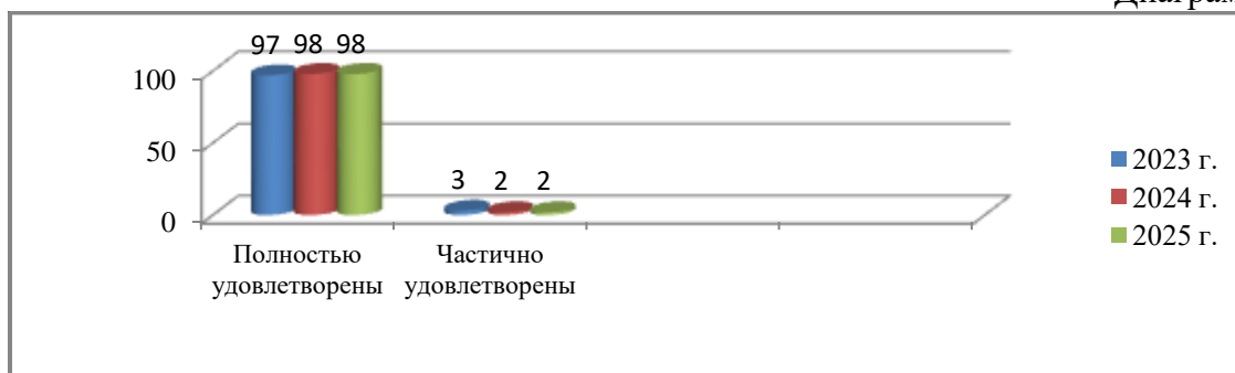
Диаграмма № 4

Изучение мнения участников образовательных отношений в детском саду осуществляется регулярно 1 раз в квартал. По итогу 2025 года результаты анкетирования проведенного среди 294 родителей (законных представителей) показали, что 98% опрошенных удовлетворены условиями и качеством предоставляемой муниципальной услуги в части реализации основной образовательной программы дошкольного образования и в части ухода и присмотра за воспитанниками. Два процента родителей (законных представителей) выразили частичную удовлетворенность качеством предоставляемой муниципальной услуги по показателям состояние материальной базы МАДОУ и организация питания.