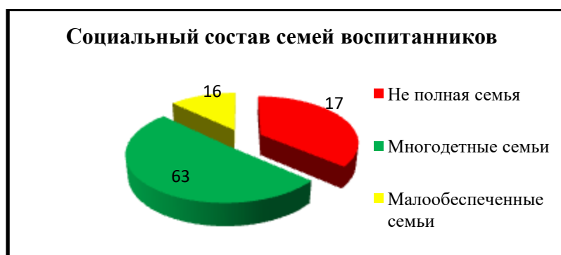
Социальный статус семей