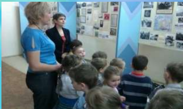
Посещение краеведческого музея