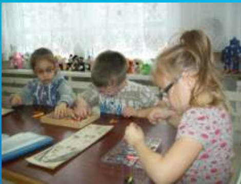
Упражнения с предметами