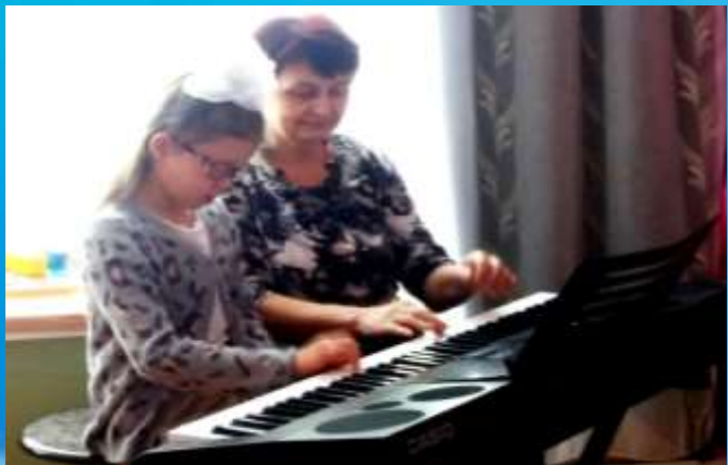
Обучение игре на музыкальном инструменте детей с ОВЗ ДМШ №2