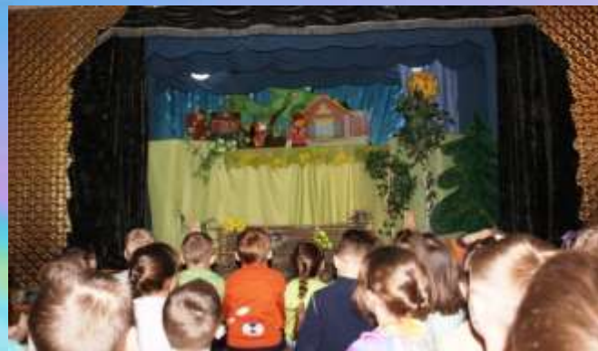
Представление кукольного театра имени А.К. Брахмана