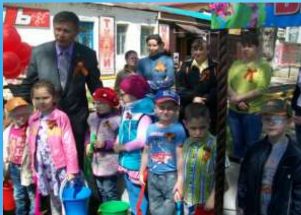
Посадка деревьев на «Аллее Ветеранов» с предприятием «Рассвет»