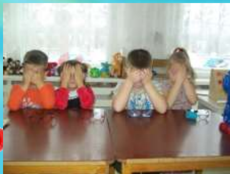
Пальминг (по Бейтсу)