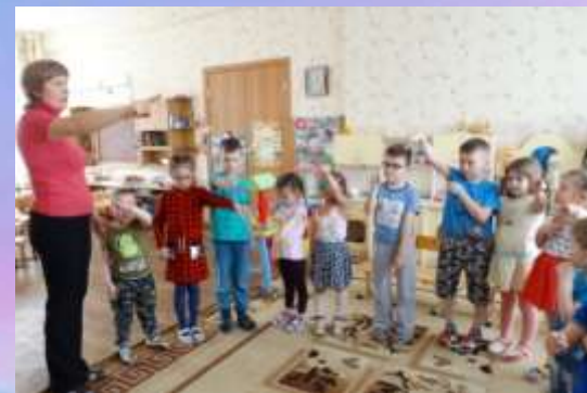
Упражнения по словесной инструкции