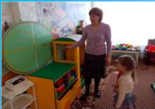
Упражнения по зрительным тренажёрам